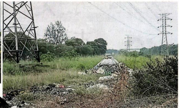
■高压电缆下的国能保留地，居然成为焚烧垃圾地点，非常危险。

(巴生16日讯) 非法公开焚烧垃圾无所不在，这回居然是在高压电缆下，不法分子的行为让人发指！