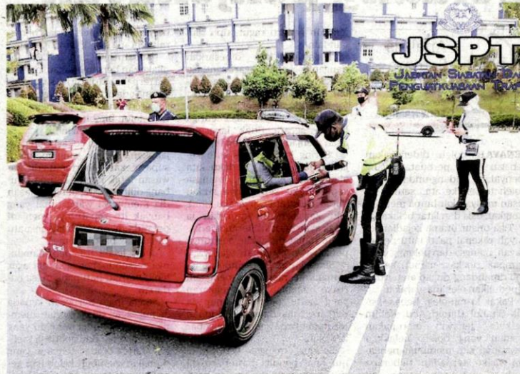
SEBAHAGIAN kenderaan warga PDRM yang diperiksa menerusi satu operasi khas di pintu masuk Bukit Aman, Kuala Lumpur semalam.