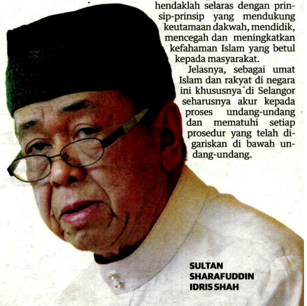
SULTAN SHARAFUDDIN IDRIS SHAH

Jelasnya, sebagai umat Islam dan rakyat di negara ini khususnya di Selangor seharusnya akur kepada proses undang-undang dan mematuhi setiap prosedur yang telah digariskan di bawah undang-undang.