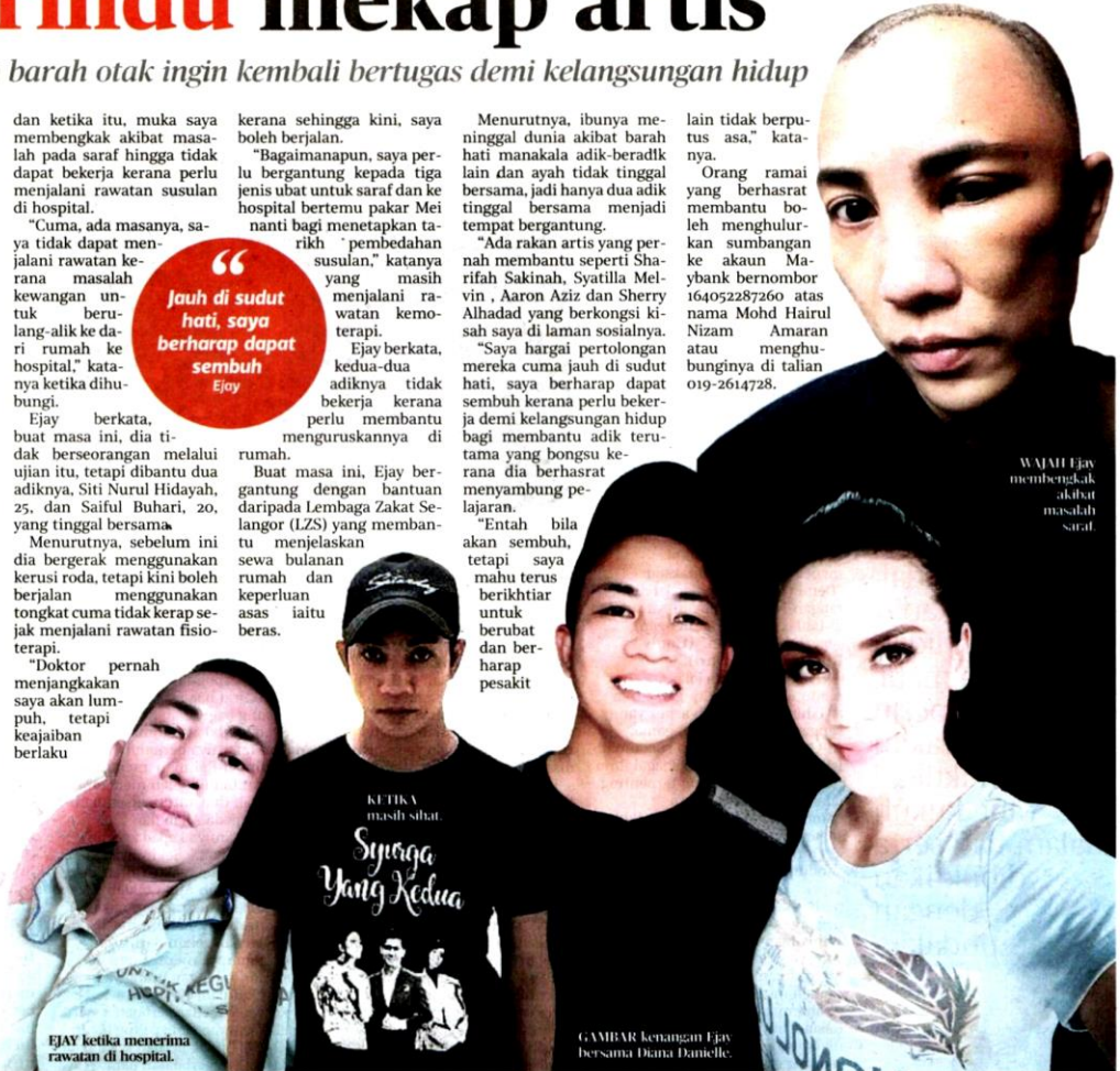
KETIKA masih sihat.

“ Jauh di sudut hati, saya berharap dapat sembuh Ejay ”