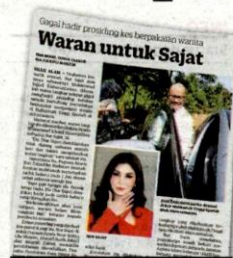
KERATAN Kosmo! 24 Februari 2021.

"Kita sediakan doktor kerana hanya doktor sahaja boleh menentukan dakwaannya itu, jadi sila datang. Malah, menerusi