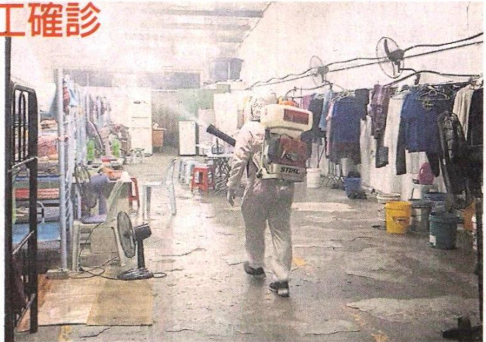
■无拉港特别行动队协助消毒员工宿舍。

较早时，卫生部在本月4日通报的武吉3路感染群 (Kluster Jalan Bukit Tiga) 也源自武吉安甲工业区一家工厂，该工厂有140名员工受检，其中14人确诊。