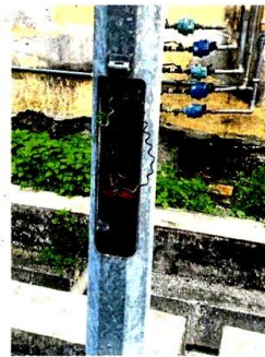
Some poles housing the electrical components for the street lights have been vandalised.

Residents in Puncak Alam seek council's help to fix faulty street lights