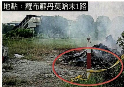
■执法人员拉起警戒线，才一天便遭人拆下，非常猖獗。