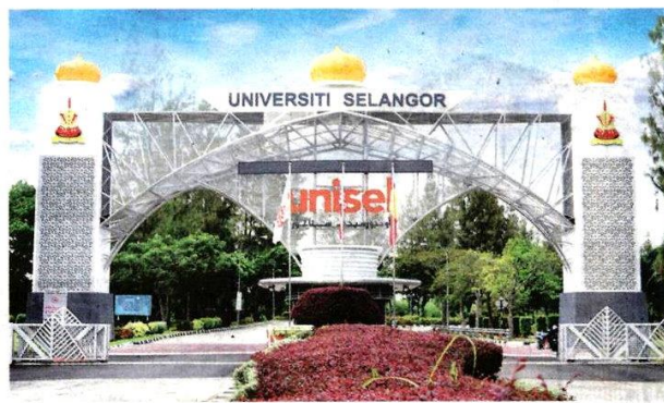
UNISEL merupakan tempat penuntut mendapat pendidikan berkualiti dengan yuran yang rendah.

Penuntut mampu dibentuk secara holistik dengan menitikberatkan elemen kerohanian melalui Trek Huffaz yang semestinya membawa nilai tambah kepada Program Asasi di PADU. Penuntut Trek Huffaz juga akan mendapat sijil tambahan daripada Pusat Islam UNISEL melalui penilaian daripada masjid UNISEL.