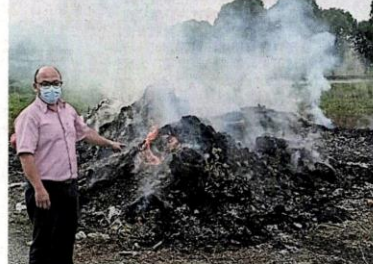
■垃圾。■非法垃圾场也引来拾荒者，到来翻掘垃圾，导致环境更加脏乱。