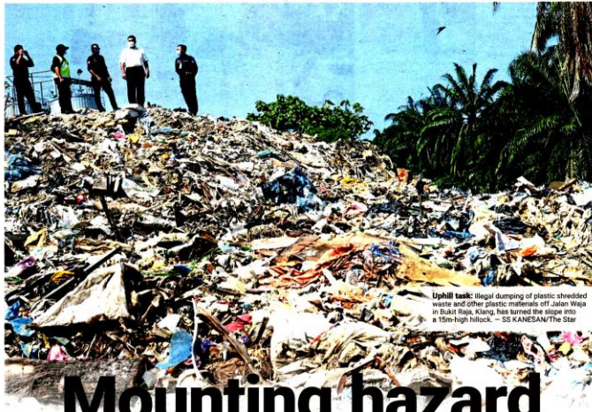
Uphill task: Illegal dumping of plastic shredded waste and other plastic materials off Jalan Waja in Bukit Raja, Klang, has turned the slope into a 15m-high hillcock.