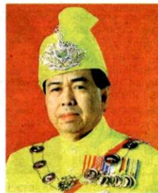
SULTAN SHARAFUDDIN IDRIS SHAH