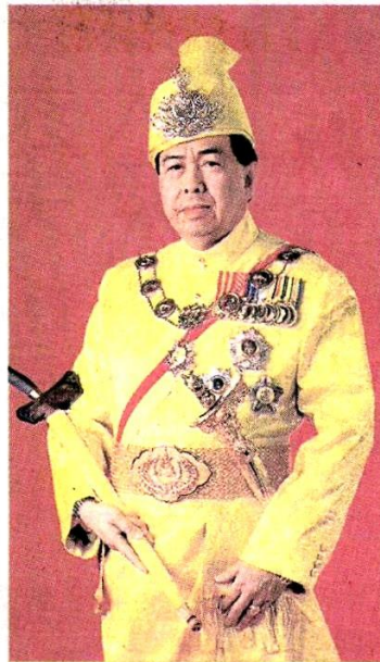
■雪州苏丹沙拉弗殿下

(莎阿南16日讯)雪州苏丹沙拉弗殿下對於部分穆斯林没有谨言慎行深表痛心,尤其小撮穆斯林想要脱教的言论或行为,皆可能导致一些人脱离伊斯兰等。