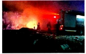
Klang Fire and Rescue Department personnel fighting a blaze at the illegal dumpsite off Jalan Waja in Bukit Raja last month.