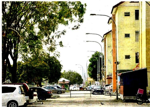
The lack of functioning street lights at Flat Saujana Mawar in Taman Alam Jaya has led to an increase in petty theft and break-ins.

"However, they are not sufficient to cover the entire area. The JMB had planned to fix the street