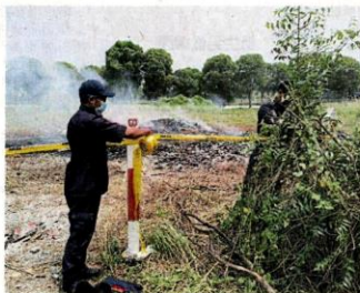
■不可继续闯入。 ■执法人员重新拉起警戒线，并警告民众